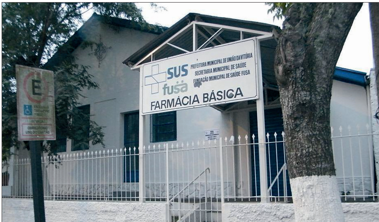
Figura 02. Antigas instalações Farmácia Municipal Central (até 2017).