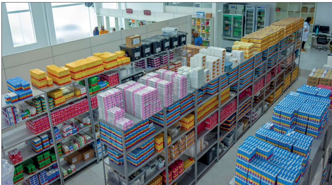
Figura 03. Central de Abastecimento Farmacêutico - CAF (2023).