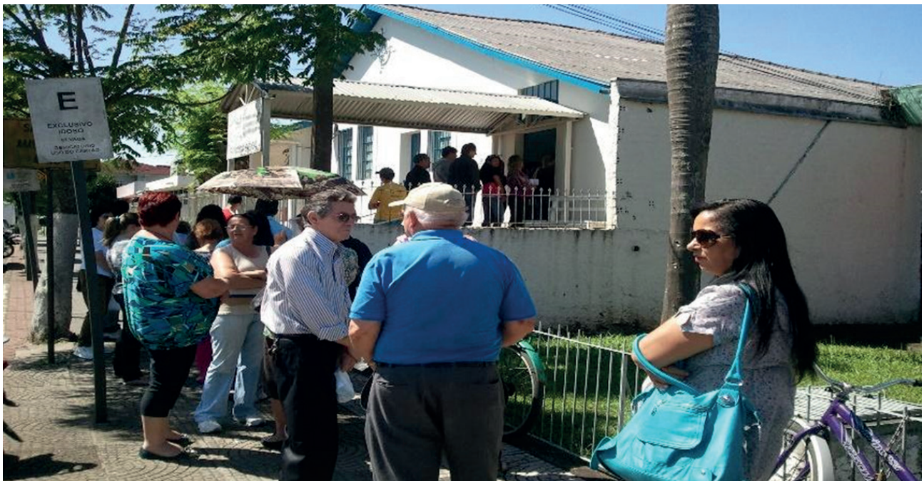
Figura 01- Antigas instalações da Farmácia Municipal Central (até 2017).