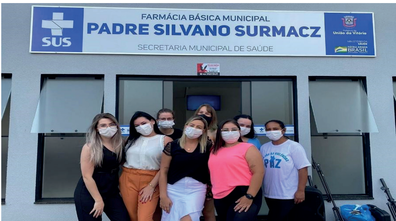
Figura 07. Farmácia Distrital de São Cristóvão- Inauguração (2022).