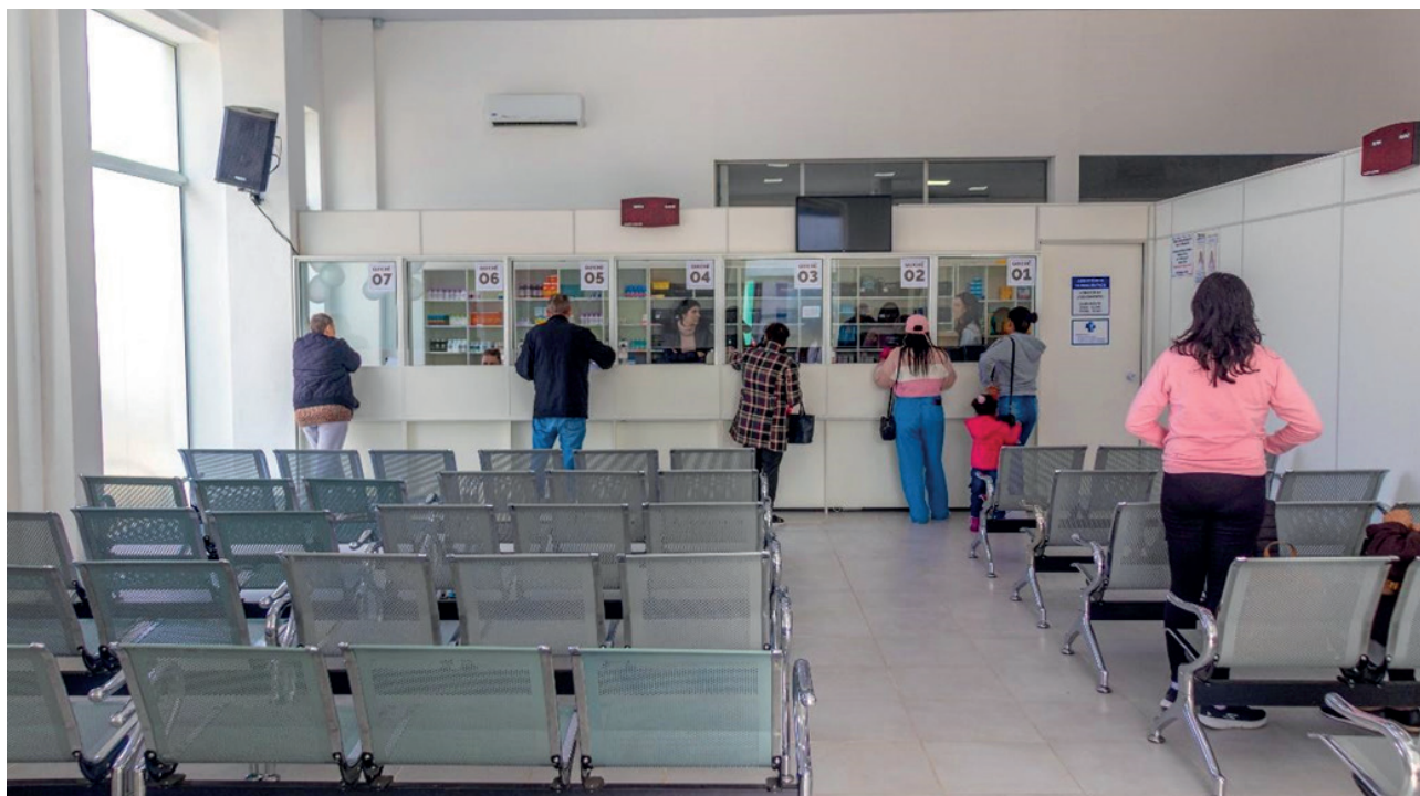
Figura 05. Área de atendimento Farmácia Municipal Central (2023).