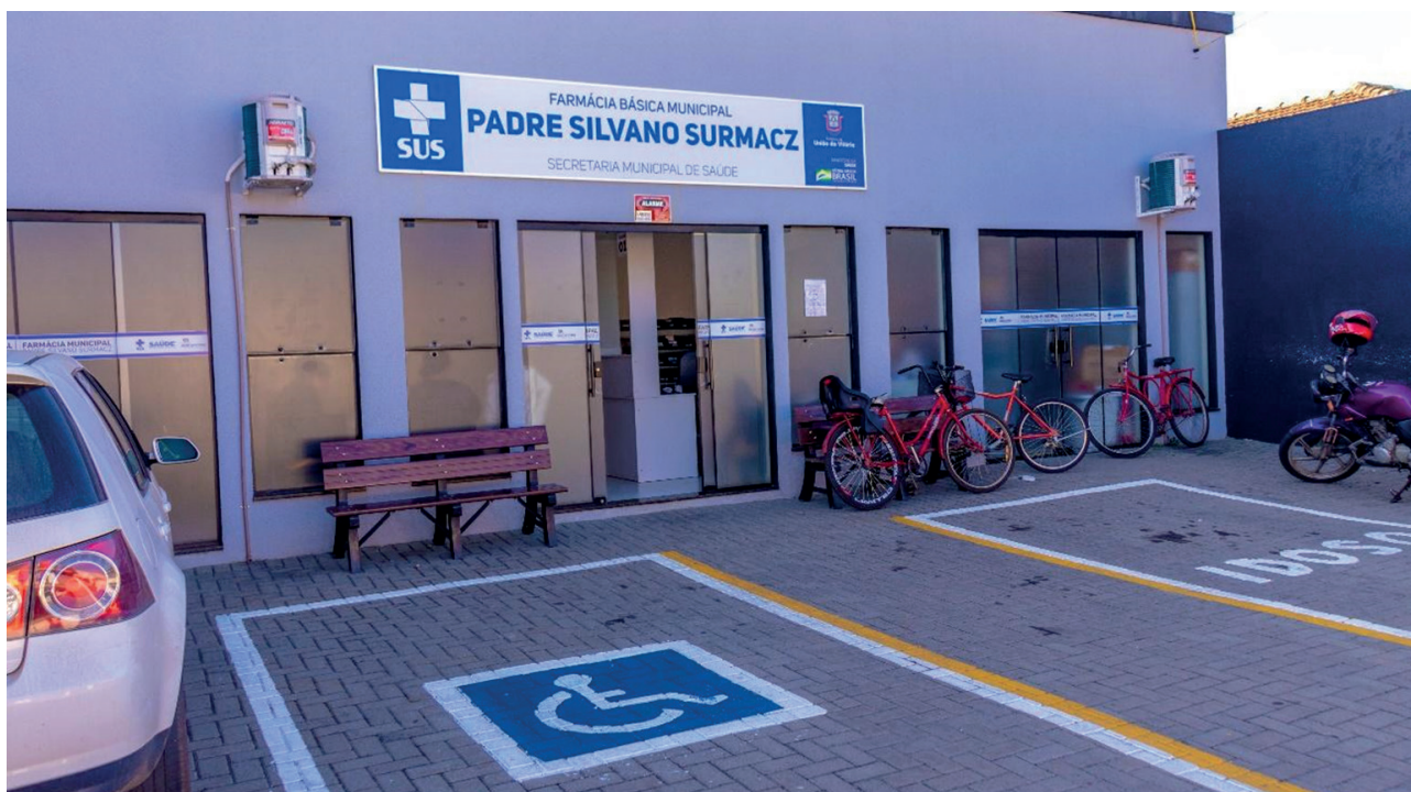
Figura 09 - Farmácia Distrital de São Cristóvão (2023).