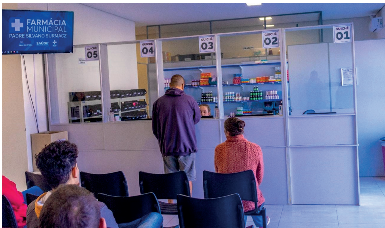
Figura 08 - Farmácia Distrital de São Cristóvão (2023).