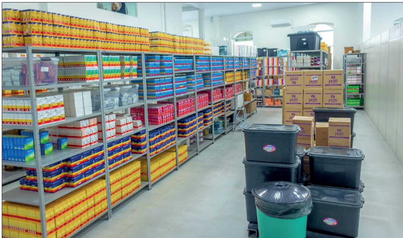
Figura 04. Central de Abastecimento Farmacêutico- CAF- (2023).