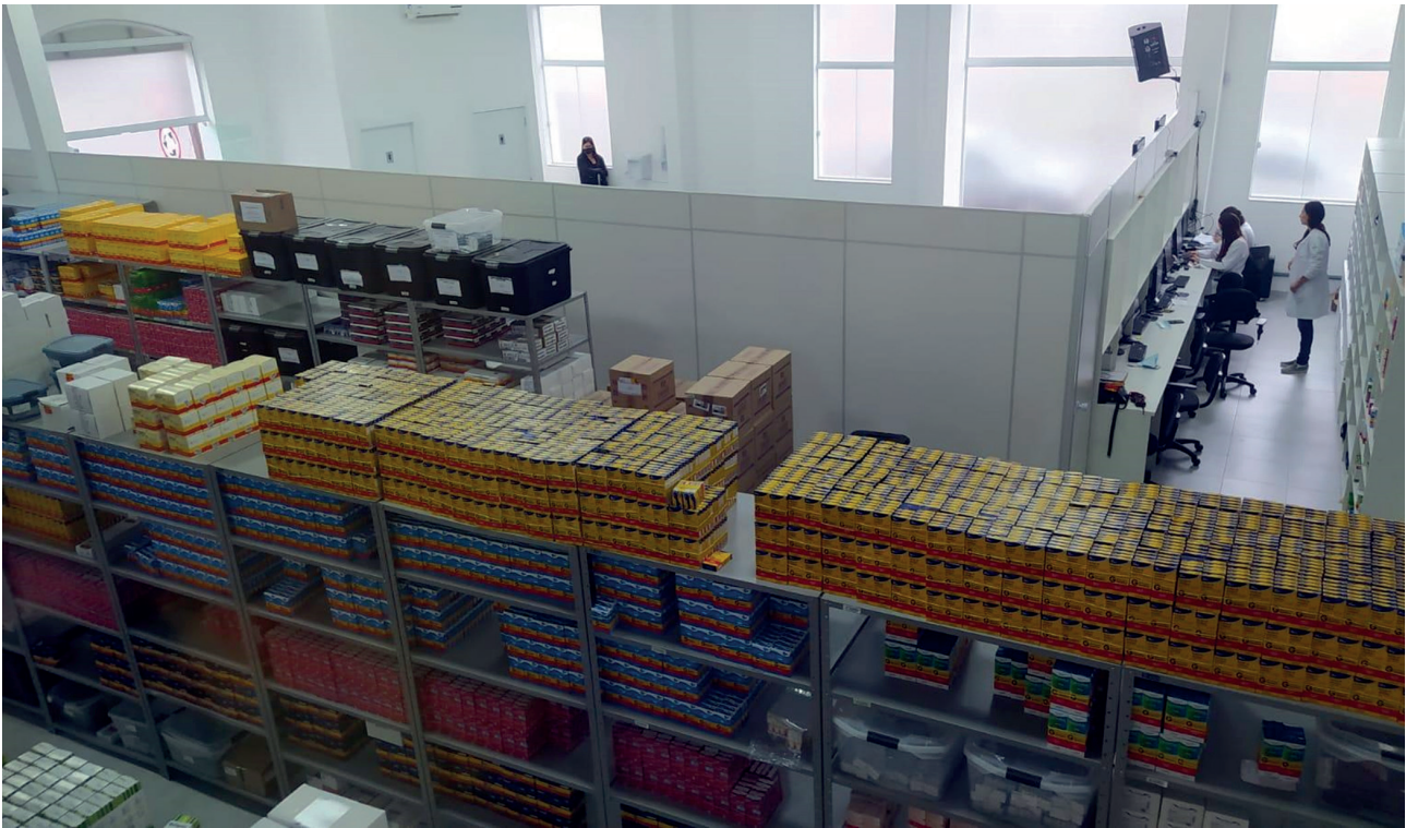
Figura 06. Farmácia Municipal Central (2023).